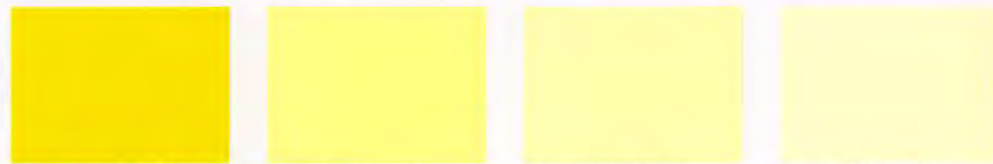
AMARILLO LIMÓN AMARELO-LIMÃO

Para realizar cada una de las degradaciones, hemos utilizado como base 4 litros de pintura plástica Jalfix Satinado S-2 y hemos mezclado el tinte en el porcentaje indicado en cada pastilla de color.