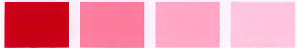
ROJO VIVO VERMELHO-VIVO

Para efectuar cada uma das degradações, utilizámos como base 4 litros da tinta plástica Jalfix Acetinado S-2 e misturámos o corante na percentagem indicada em cada pastilha de cor.