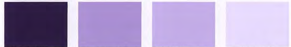
VIOLETA (sólo Jaltint Universal) VIOLETA (só para Jaltint Universal)